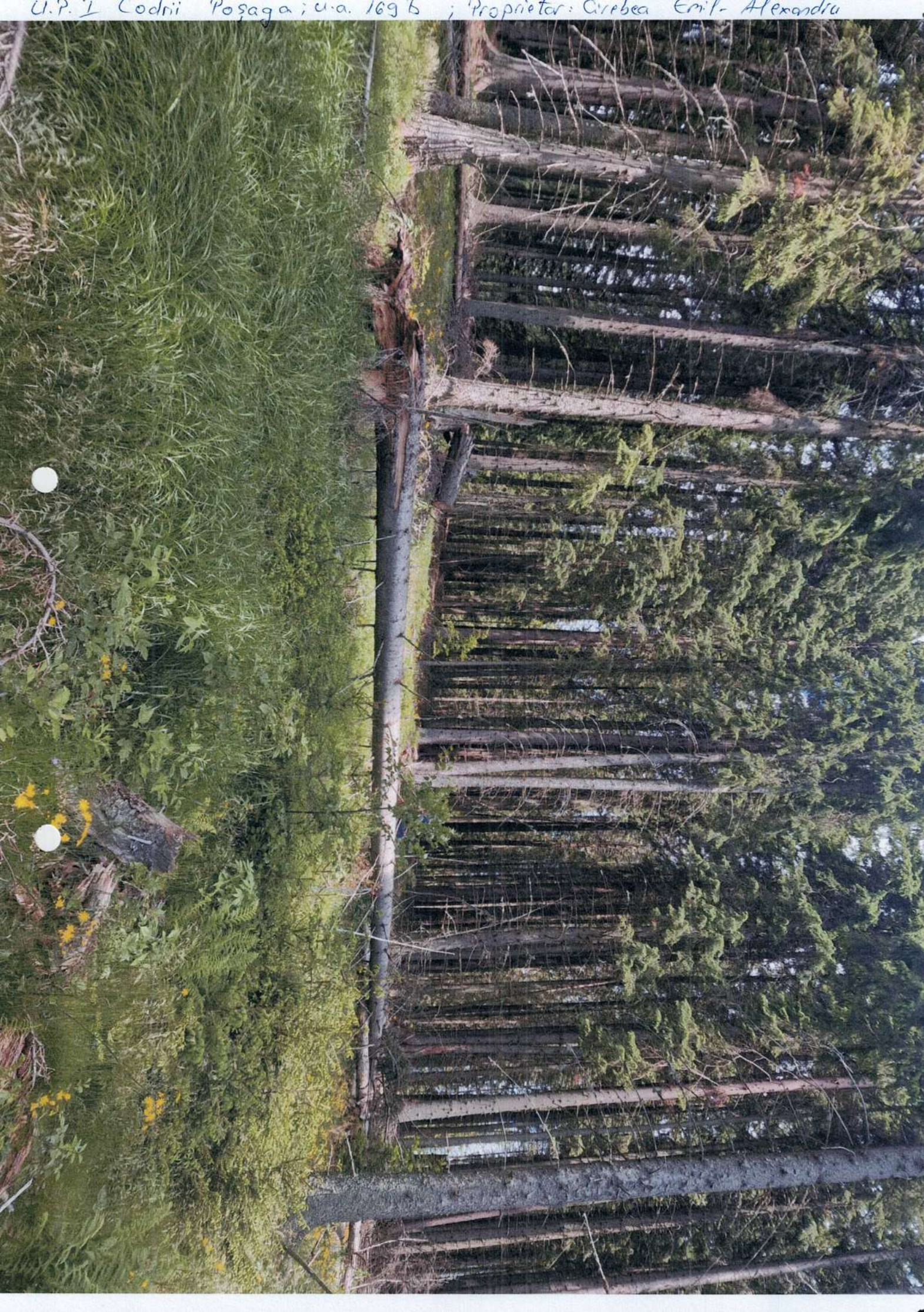
U.P. 1 Codrui Poșaga; u.a. 169 b ; Proprietar: Cereba Emil-Alexandru